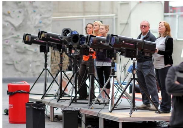
Lichtplan in uitvoering tijdens de European Youth Cup Edinburgh 2011 in Ratho.

Klimhallen zijn vaak te donker om scherpe foto's te kunnen maken. Het bijlichten van de klimwanden tijdens de wedstrijd is dan ook vaak noodzakelijk om goede foto's te krijgen. Het beste resultaat is te verkrijgen wanneer aan de zijkanten van de wand voor slaglicht wordt gezorgd en dat de klimmer verder tijdens zijn poging wordt gevolgd door een volgspot. Het slaglicht zorgt ervoor dat de foto's niet te veel contrast krijgen vanwege het felle licht van de spot. Deze volgspot mag de klimmer ruim in beeld hebben om het niet al te fel te laten zijn. Wat niet alleen de foto's ten goede komt maar ook de klimmer, aangezien het in de spotlicht behoorlijk warm kan zijn. Daarnaast is het van belang dat het directe vervolg van de route door de volgspot verlicht wordt.