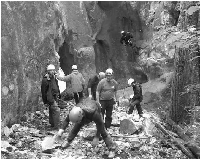
Werkdag met Bergpalliaters: heraanleg pad in Pont-à-Lesse na schade door gevallen rotsblokken en verwijderen van losse steen uit de route 'Speedy Gonzales'

Kobe: "Eigenlijk onderhouden we de klimgebieden in de Belgische massieven. Ten eerste is dat het onderhoud van de toegang tot het gebied, de paden. Want de klimroutes moeten natuurlijk bereikbaar blijven. Ten tweede doen we uiteraard ook het onderhoud van de wand: loszittende stenen loskappen die er elk jaar met vorst weer uitkomen en dikwijls op het pad vallen. Ten derde is er ook het onderhoud van de haken, die we na een tijd vervangen wegens slijtage. En daarnaast bouwen we ook aan potentiële nieuwe routes."